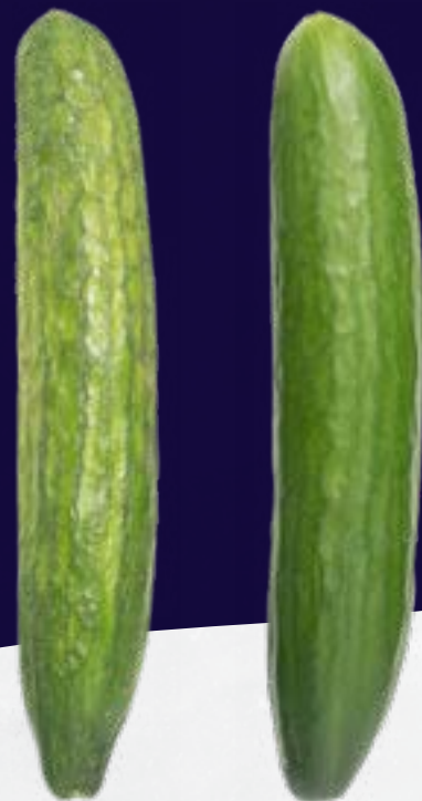
SIN RECUBRIMIENTO SUFRESCA